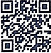
श्रम संसार वेबसाइट

थप जानकारीका लागि यस उपमहानगरपालिकाको रोजगार सेवा केन्द्रमा समेत सम्पर्क गर्न सकिनेछ ।