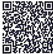
श्रम संसार Mobile APP